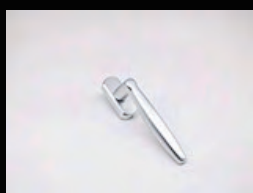
• 雙數門用旋轉把手