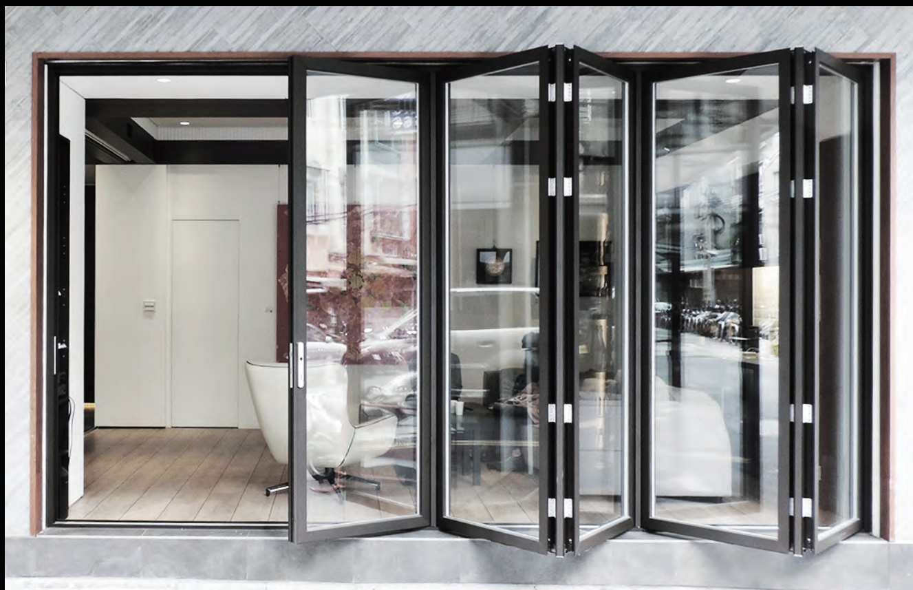
板橋 樂居建材知識中心 / AIW FD摺疊門