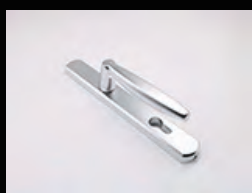
• 單開門用水平把手